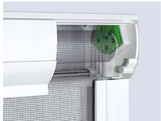
Höherverstellung der Welle